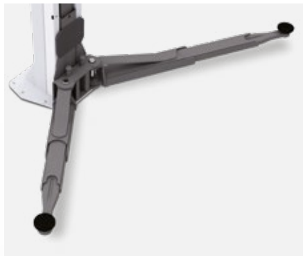
Brazo totalmente extendido.