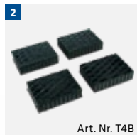
Art. Nr. T4B