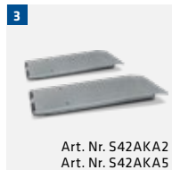
Art. Nr. S42AKA2 Art. Nr. S42AKA5