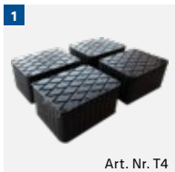
Art. Nr. T4