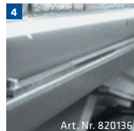
Art. Nr. 820136