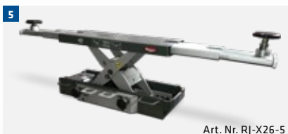
Art. Nr. RJ-X26-5