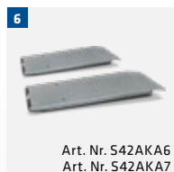
Art. Nr. S42AKA6 Art. Nr. S42AKA7