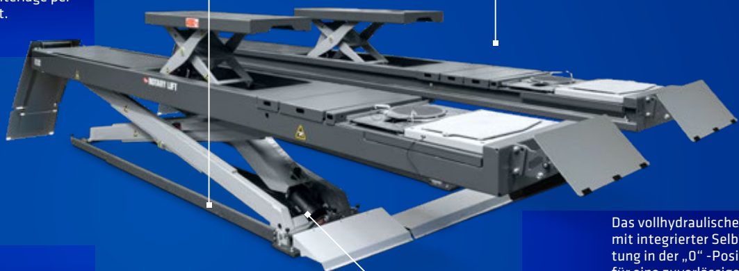
Bild zeigt LTAK-PD8 Modell, Bodenaufliedend mit Auffahrampen

Das Bedienpult besitzt ein werkseitig vormontiertes, mit der Hebebühne verbundenes Hydraulikaggregat und trägt damit maßgeblich zu einem geringen Installationsaufwand bei. Die Platzierung ist links oder rechts möglich.