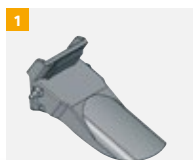
Numéro d'article G800A131