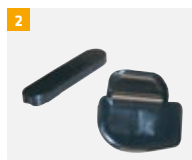
Numéro d'article G800A132