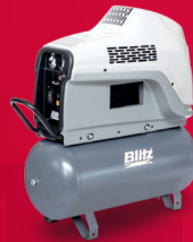
Abbildung zeigt: Monsun Fast R