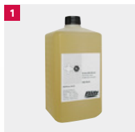
1 BLITZ Spezial-Kompressorenöl für Schraubenverdichter