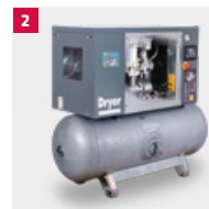
2 MONSUN Fast D - Kompakt-Schraubenkompressor mit Kältetrockner