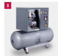
3 MONSUN Fast S - Kompakt-Schraubenkompressor als Druckluftstation auf liegendem Druckbehälter mit Kältetrockner