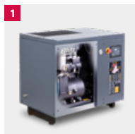
1 MONSUN Fast