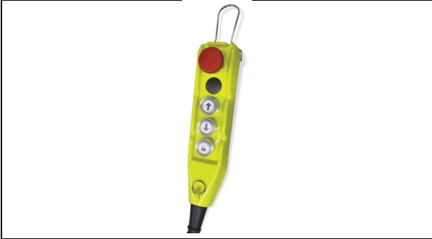
Rotary-Blitz P 17 Vario-remote-control-MI