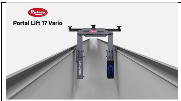
Rotary-Portal lift 17 Vario-Hero-A