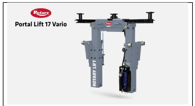
Rotary-Portal Lift 17 Vario-Hero-B

Rotary-Portal Lift 17 Vario-es-PR-2024-02