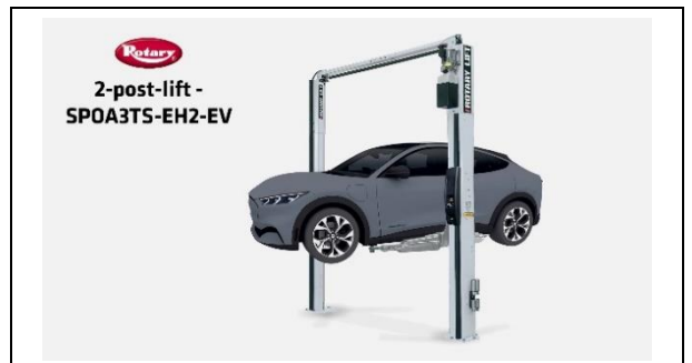
Pont élévateur à 2 colonnes - SPOA3TS-EH2-EV