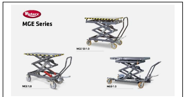
Tables élévatrices - Série Master Gear