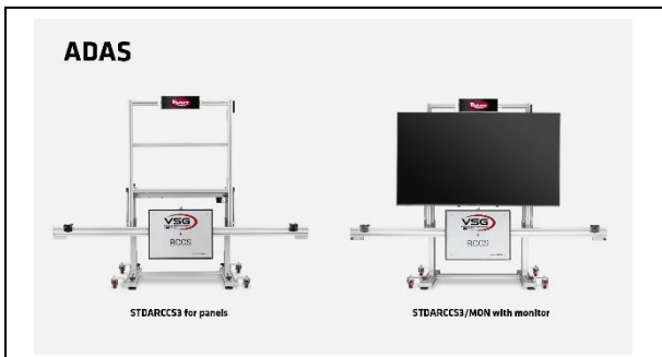
Aligneuses de roue - ADAS