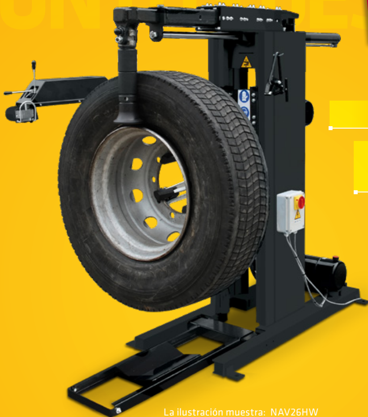
La ilustración muestra: NAV26HW

+ Maquinaria de instalación de neumáticos de 11-27" electrohidráulica para neumáticos de camión y autobús + Diseño especial con ahorro de espacio, ideal para talleres pequeños, servicio de flotas y servicio móvil