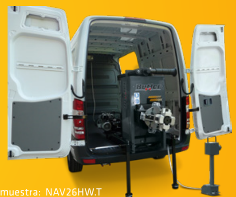
La ilustración muestra: NAV26HW.T

Abrazaderas mínimas de sujeción de 330 mm (12"), ideal para acomodar neumáticos de 22,5" sin esfuerzo