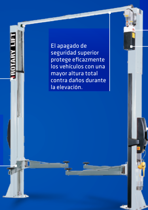
La ilustración muestra SPO40E con accesorios opcionales.

Para un plus en ergonomía y economía, el 2º panel de control es estándar en el SPO40. Se equipa una unidad de control con una conexión de 220 V (con fusible de 16 amperios para herramientas de mano eléctricas) y la segunda con preparación de aire comprimido.