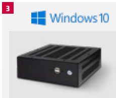
N° article VSG.PC500.701909