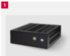
N° article 21238