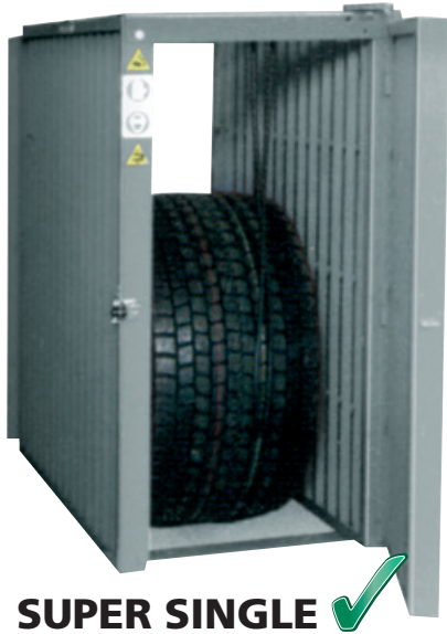
SUPER SINGLE ✓