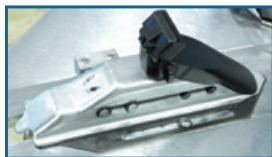
G800A98 →22" G800A6 →26"