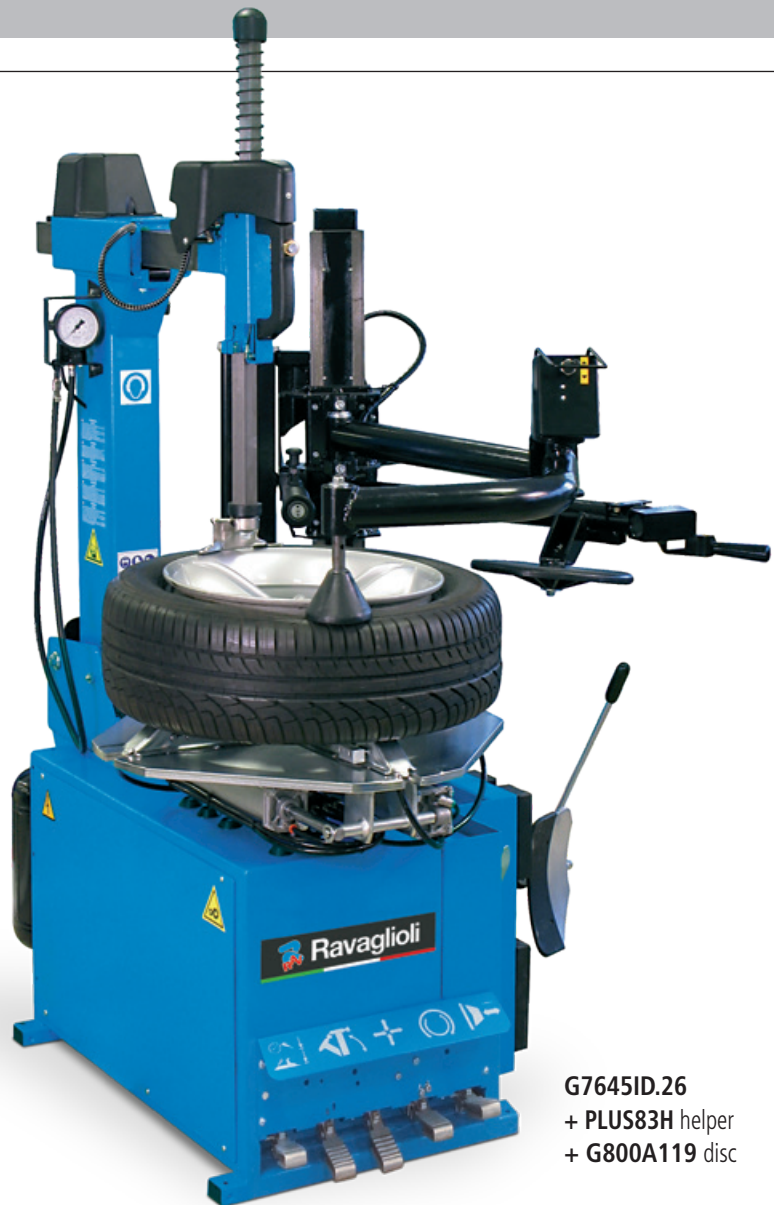
G7645ID.26 + PLUS83H helper + G800A119 disc

Por su destacada altura del palo vertical y del eje porta util es posible trabajar en cualquier rueda de ancho máximo 17" (431 mm) .