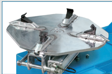
10" - 22" Mandrino standard. Standard chucking table. Standard Spanntisch Plateau standard Plato estándar