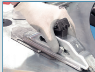
10" - 26" Mandrino riposizionabile a due posizioni. Chucking table with adjustable positioning of clamps (2 slots). Spanntisch mit in zwei Positionen einstellbaren Klauen Plateau à double positionnement Plato de dos posiciones.