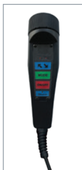
Comandi azionamento piastre su torcia con cavo di 5500mm. Standard play detector controls on torch with 5500mm cable.